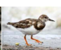
Tournepièrre à collier