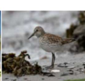
Bécasseau à Croupion blanc