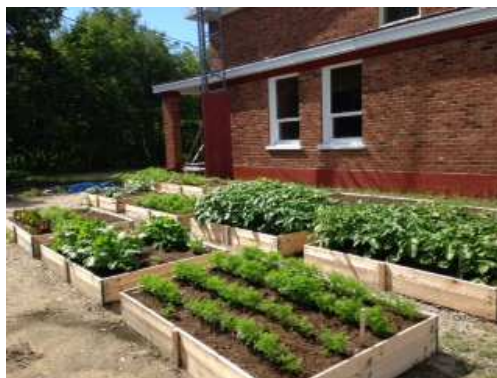
Le jardin communautaire

Rappelons que le projet a été rendu possible entre autre avec la participation financière d'Action-Santé Haute-Côte-Nord.